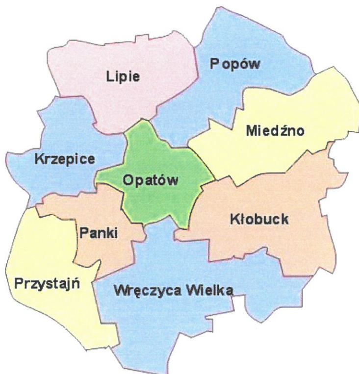
Rysunek 1. Gmina Przystajń w powiecie kłobuckim.

Gmina Przystajń zajmuje obszar 89 km 2 . Według danych GUS z końca 2019 roku Gmina liczy 5.876 mieszkańców, a gęstość zaludnienia to w przybliżeniu 66 osób/km 2 . Gmina Przystajń leży w południowo zachodniej części powiatu kłobuckiego. Gmina Przystajń sąsiaduje z następującymi jednostkami: Krzepice, Panki, Wręczyca Wielka, Ciasna, Herby, Olesko.